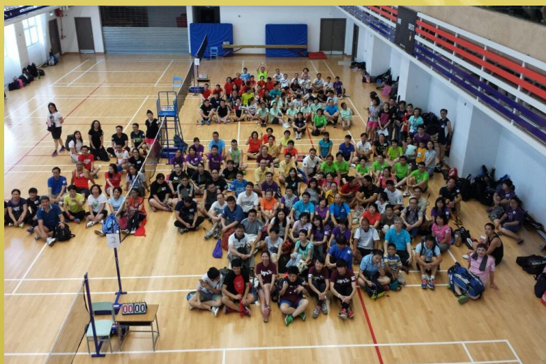
極受成長班歡迎的羽毛球比賽