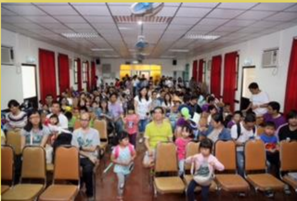
家庭日營中的家長講座

展望在2016年，甚願牧養組能夠繼續與眾隊長和家長們同行，為他們奉上適切的關注和勉勵，建設神家和神所賜地上的家。